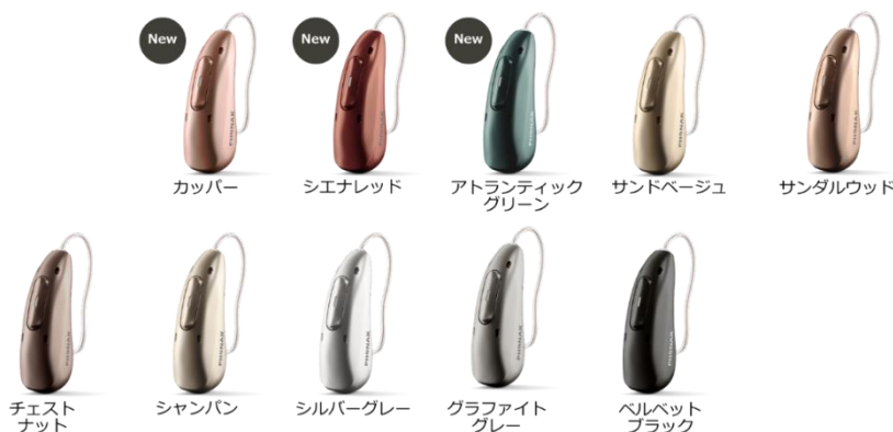
※サンドベージュ、シャンパン、シルバーグレー、グラファイトグレー以外は後日発売予定