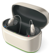
Phonak ChargerGo RIC I