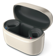
Phonak Charger RIC I