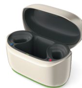
Phonak ChargerGo RIC Sphere I